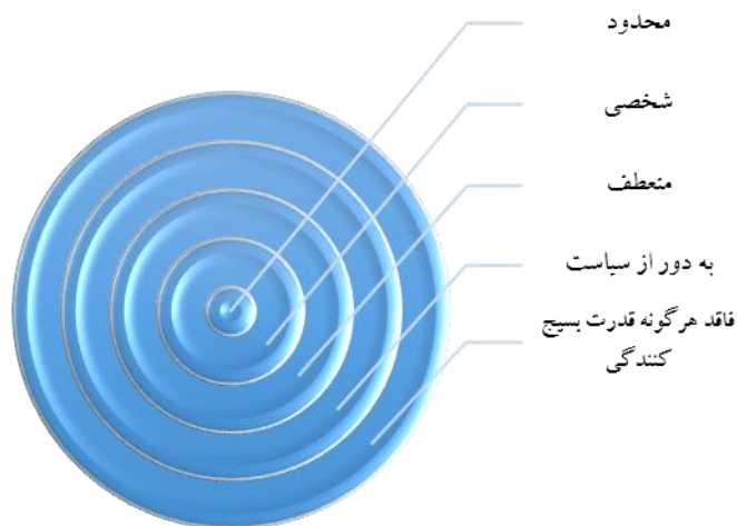
شکل شماره ۲. ویژگی‌های مذهب مطلوب از دیدگاه بن سلمان در نظام عربستان سعودی (منبع: (Ulrichsen, 2019: 113))

سلمان می‌باشد و نقشه آن نیز در سند ۲۰۳۰ تئوریزه شده است، بایستی اذعان داشت که یکی از اهداف مهم بن سلمان از مدرنیزاسیون در عربستان، تحقق سکولاریزم و انزوای وهاپیون سنتی و رادیکال این کشور از عرصه قدرت و سیاست می‌باشد. به دیگر سخن، بن سلمان درصدد است وهاپیسیم را تا حدود یک مذهب فردی تقلیل دهد. در تبیین این مسئله می‌توان به دو عامل مهم و اثرگذار اشاره نمود. نخست، فشارهای اعمال شده از سوی آمریکا و دیگر متحدین غربی به بن سلمان برای تحقق سکولاریزم و دوم؛ تجربه موفق الگوی توسعه سیاسی مبتنی بر سکولاریزم در جهان اسلام به ویژه در ترکیه. بنابراین مذهب مورد نظر بن سلمان یک مذهب فردگرا، فاقد هرگونه قدرت بسیج‌کنندگی، محدود و دارای انعطاف زیادی است.