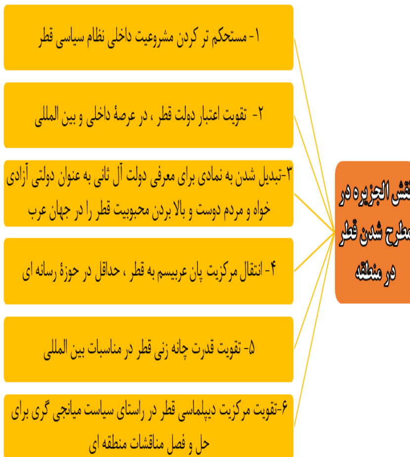
شکل شماره ۳) نقش الجزیره در مطرح شدن قطر در منطقه