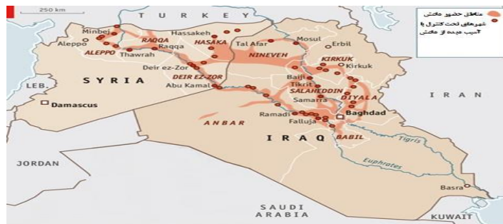
نقشه شماره ۲: گسترش قلمرو داعش در طول رودخانه‌های دجله و فرات

داعش بدون داشتن ارتش منظم توانست در مدت کوتاهی بخش‌های قابل توجهی از دو کشور عراق و سوریه که دارای ارتش منظم و مجهز به سلاح‌های پیشرفته بودند، را به تصرف درآورد (عباس‌زاده ونحعی، ۱۳۹۸:۳۶). شکل‌گیری داعش و گسترش آن در عراق و سوریه یکی از مهمترین بحران‌های خاورمیانه در یک دهه اخیر بوده است (نویدی‌نیا و گودرزی، ۱۳۹۸:۲۱).