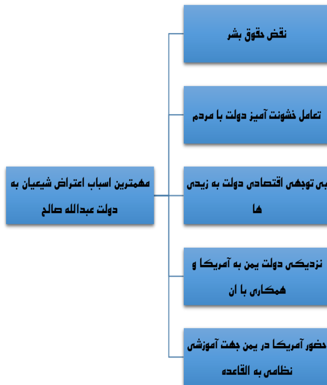
تصویر شماره ۴: مهم‌ترین دلایل اعتراض شیعیان در دولت علی عبدالله صالح

در سال ۲۰۰۴ حوثی‌های یمن در اعتراض به تبعیض دولت میان آنان و دیگر طوایف به مخالفت با دولت مرکزی یمن پرداختند. آنان به اموری چون سخت‌گیری دولت مرکزی نسبت به زیدی‌ها، تبعیض میان آنان و دیگر قبایل یمن، تعامل خشونت‌آمیز دولت با آنان، ارتباط نزدیک دولت به آمریکا، نقض حقوق بشر و مواردی از این قبیل اعتراض کردند که سبب بروز جنگ میان حوثی‌ها و دولت مرکزی شد و تا شش سال به طول انجامید و در سال ۲۰۱۰ به اتمام رسید (بیگی و باقری دانا، ۱۳۹۸: ۲۶۱).